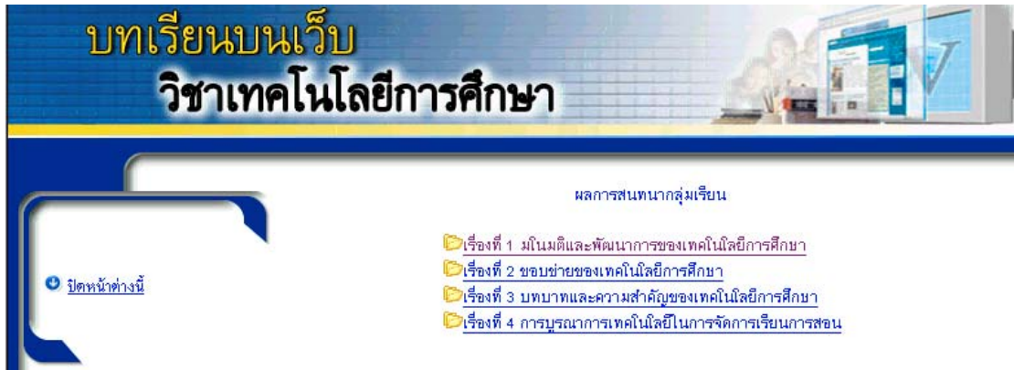
รูปที่ 21 แสดงผลการสนทนากลุ่มเรียน

ผู้ดูแลระบบสามารถตรวจสอบการร่วมกิจกรรมการสนทนาของผู้เรียน โดยต้องทำการทำเลือกข้อความ แสดงผลการสนทนา ในรูปที่ 17 แล้วเลือกกลุ่มเรียน และบทเรียนที่ต้องการตรวจสอบ ดังรูปที่ 21