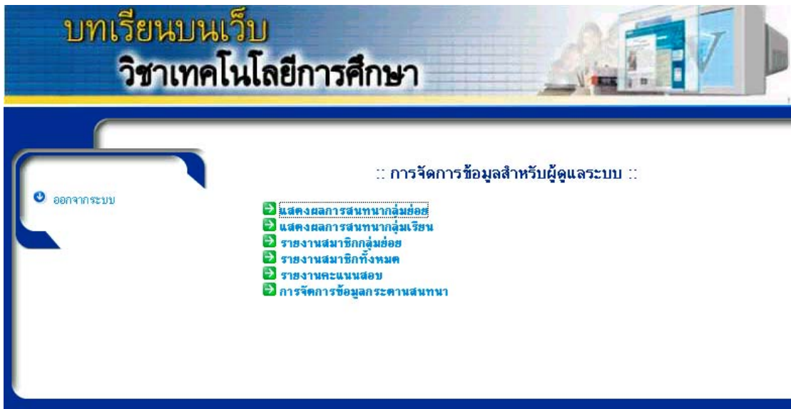
รูปที่ 17 หน้าหลักการจัดการข้อมูลสำหรับผู้ดูแลระบบ