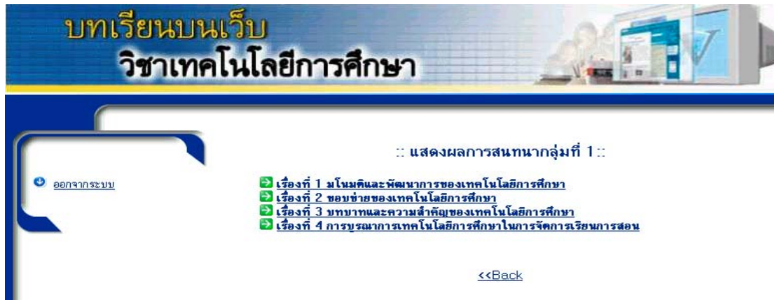
รูปที่ 19 แสดงผลการสนทนากลุ่มที่ 1

จากรูปที่ 18 แสดงให้เห็นถึง กลุ่มย่อยของผู้เรียน ซึ่งมีทั้งหมด 5 กลุ่ม ผู้ดูแลระบบสามารถเลือกกลุ่มที่ตนเองต้องการเพื่อเข้าตรวจสอบการร่วมกิจกรรมการสนทนากลุ่มย่อย