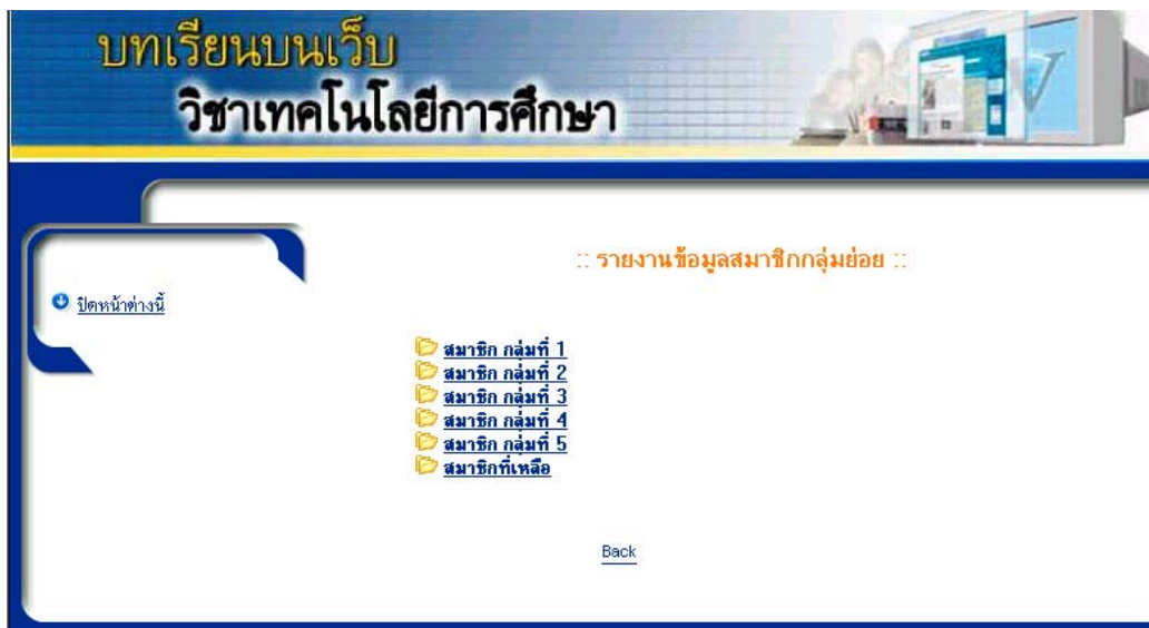
รูปที่ 23 รายงานสมาชิกกลุ่มย่อย

ผู้ดูแลระบบสามารถเปิดดูรายงานสมาชิกกลุ่มย่อยโดยต้องทำการทำเลือกข้อความ รายงานสมาชิกกลุ่มย่อย ในรูปที่ 17 แล้วเลือกกลุ่มเรียน ดังรูปที่ 23