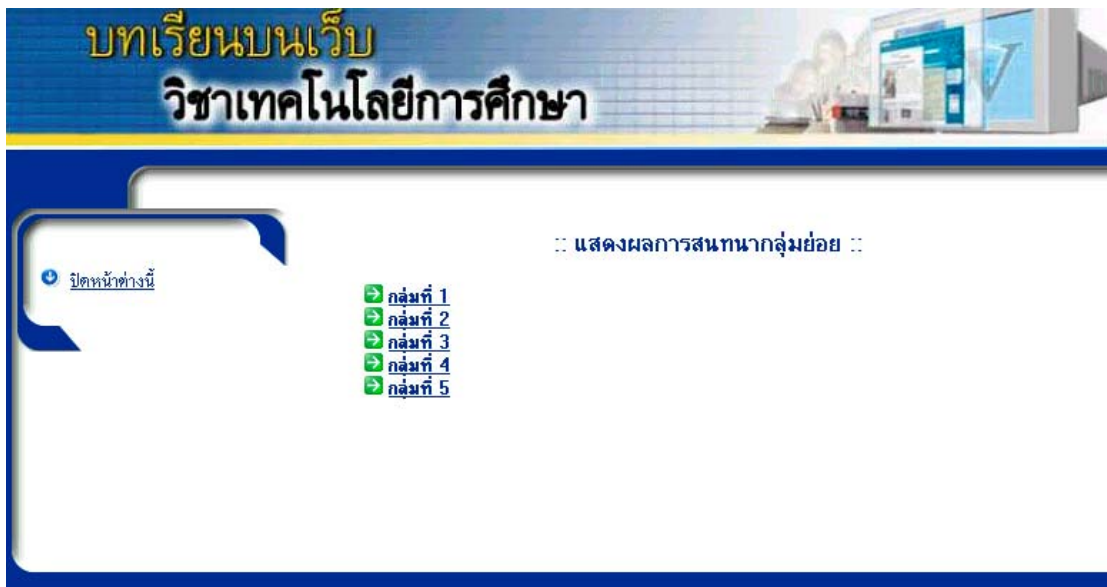
รูปที่ 18 แสดงผลการสนทนากลุ่มย่อย

ผู้ดูแลระบบสามารถตรวจสอบการร่วมกิจกรรมการสนทนากลุ่มย่อยของผู้เรียน โดยต้องทำเลือกข้อความ แสดงผลการสนทนากลุ่มย่อย ในรูปที่ 18 แล้วทำการเลือกกลุ่มเรียนย่อย และบทเรียนที่ต้องการตรวจสอบ ดังรูปที่ 19 และ รูปที่ 20