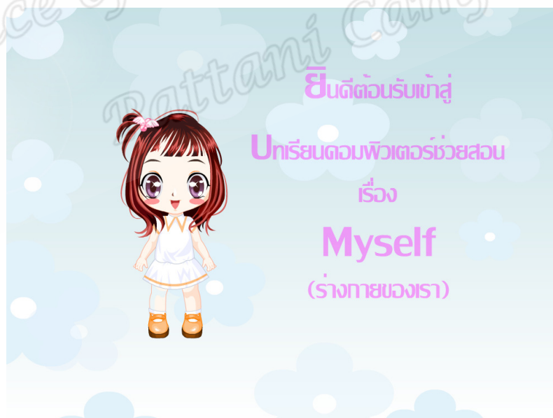
ภาพประกอบที่ 10 : หน้าแนะนำชื่อเรื่อง