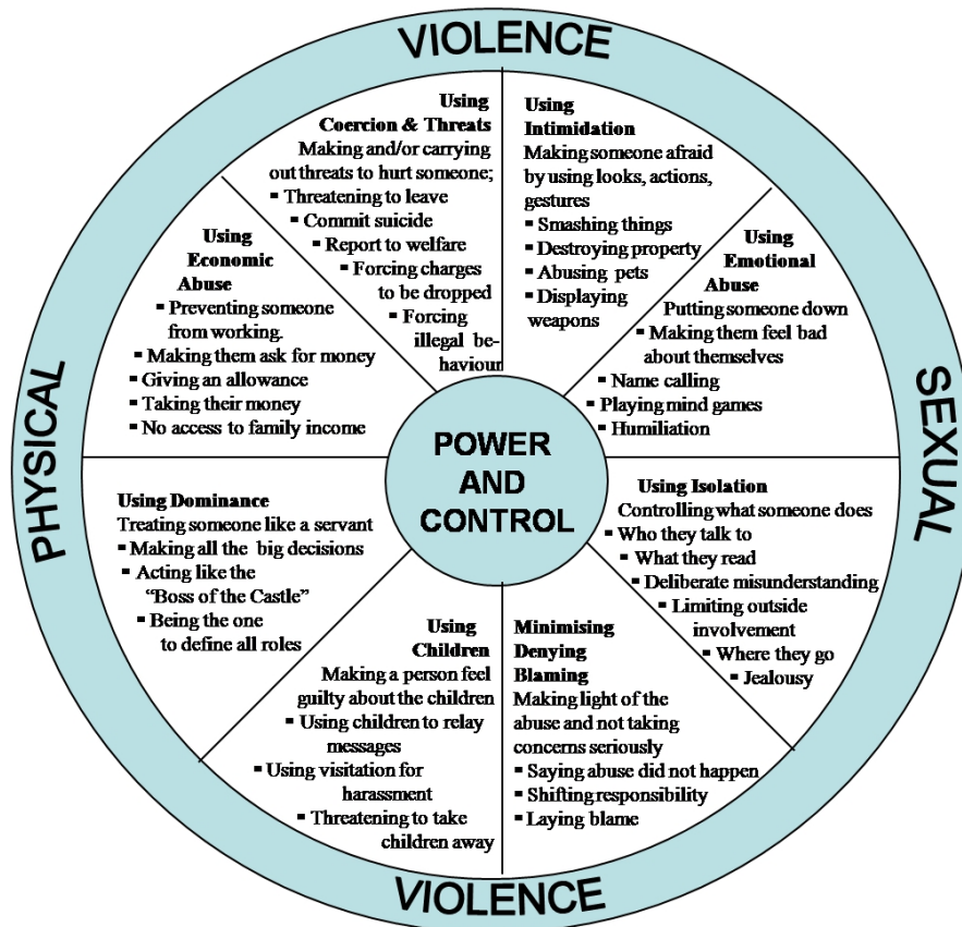
ภาพที่ 1 The Power and Control Wheel

ฝ่ายว่าจะมีการทอดทิ้ง รายงานต่อหน่วยสังคมสงเคราะห์ 8. การใช้สายตา กริยา ท่าทาง ทำลาย ขว้างปา ข้าวของ ทำร้ายสัตว์เลี้ยง หรือแสดงอาวุธให้เห็น ดังภาพ 1