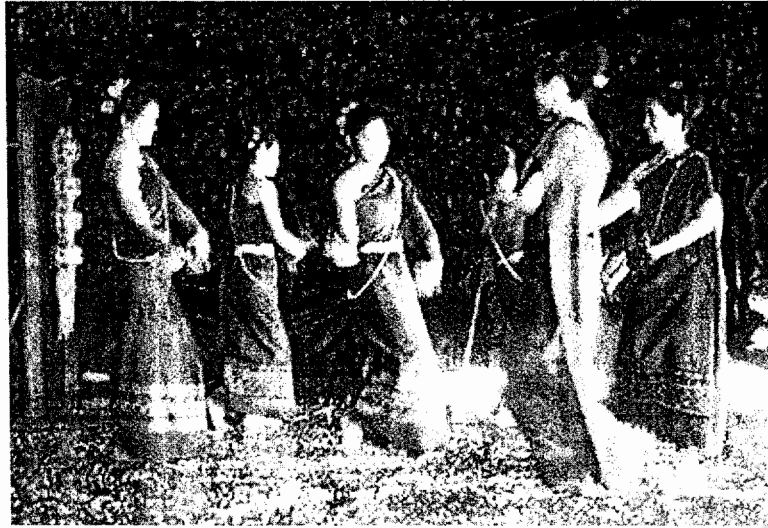
พ็อนรำทิลปะล้านนา

ส่วนประเพณีของชาวล้านนาอาจแบ่งได้เป็น 2 ประเภทตามหน้าที่ของประเพณีเหล่านั้น อันได้แก่ ประเพณีที่เกี่ยวข้องกับการดำเนินชีวิตประจำวัน เช่น โคนหมไฟ ทำบุญขวัญเดือน แอ้วสาว สู้ขวัญ แห่ศพ ขอฟน ฯลฯ และยังมีประเพณีเกี่ยวกับศาสนา เช่น ปี่ไหม่ (สงกรานต์) ตานกัวยสลาก ฯลฯ (เรณู อรรธนาเมศวร์, 2528 : 18-20)