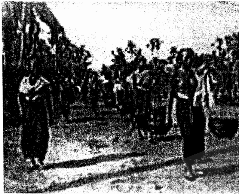
แม่ญิงล้าंनाไปภาค