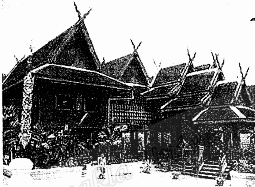
บ้านทรงล้านนาประยุกต์

จะยกเป็นนั่งร้าน ตั้งหม้อดินสำหรับใส่น้ำไว้ต้ม ได้ดูบ้านจะเอาไว้เลี้ยงสัตว์ แต่ปัจจุบันบ้านลักษณะแบบนี้จะมีเหลือไม่มากนัก จะพบได้ตามเขตชนบทที่อยู่ห่างไกลมากจากตัวเมืองเท่านั้น