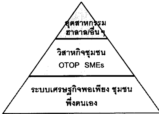
แผนภูมิที่ 4-3 ดุลยภาพในการพัฒนา มาตรการ และแนวทางในการพัฒนาเศรษฐกิจสามจังหวัดชายแดนภาคใต้