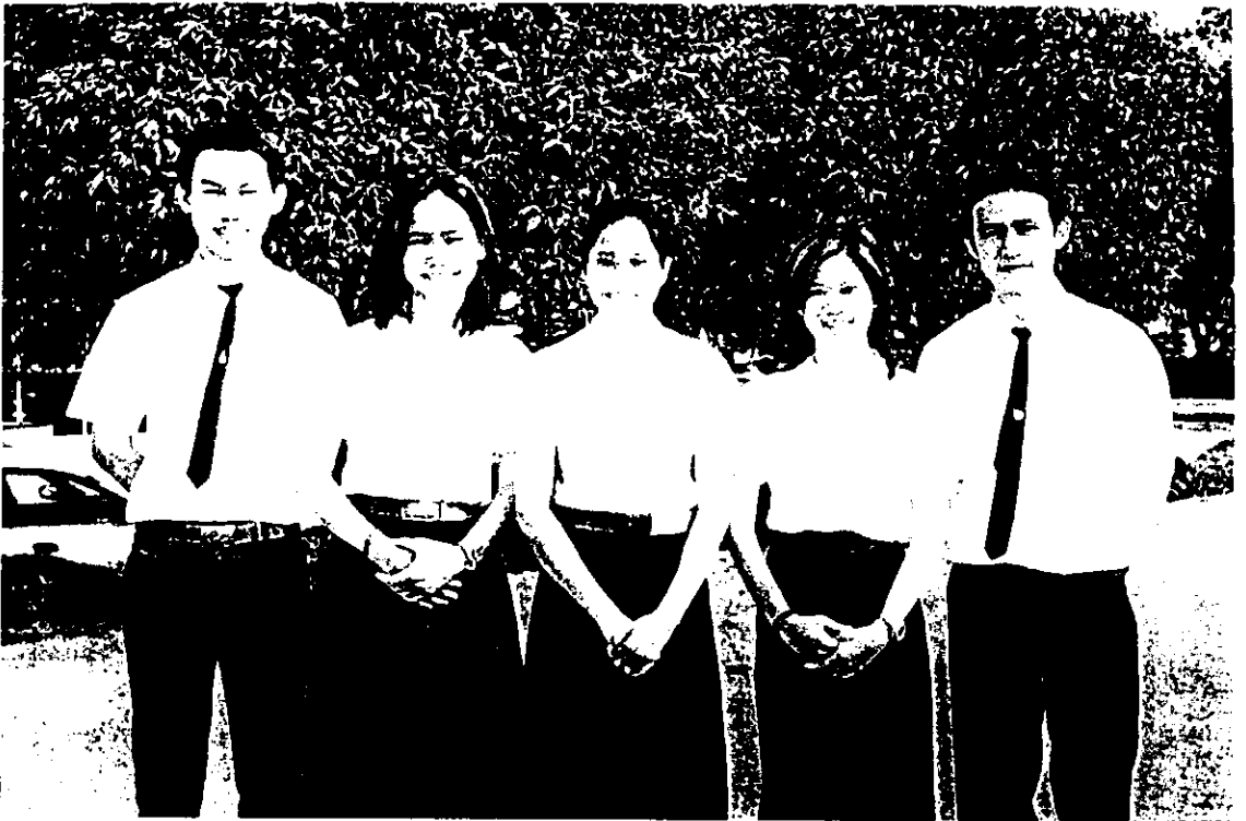
นักศึกษาที่แต่งกายเหมาะสม