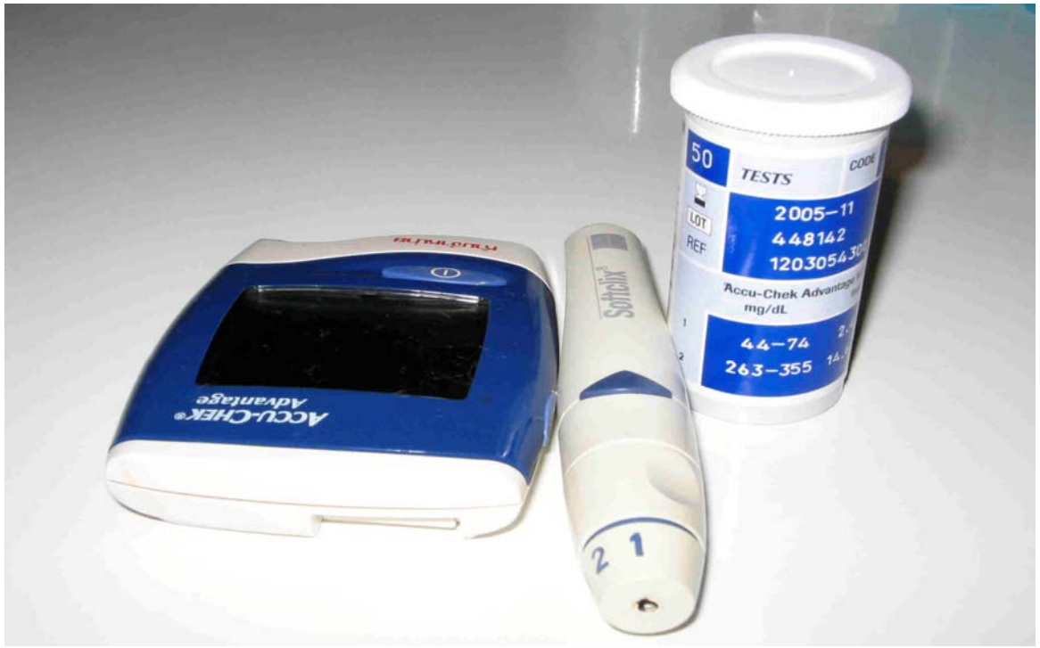
ภาพประกอบ 8

เครื่องวัดระดับน้ำตาลชนิดพกพา และแผ่นทดสอบที่ใช้กับเครื่องวัดระดับน้ำตาลในเลือด