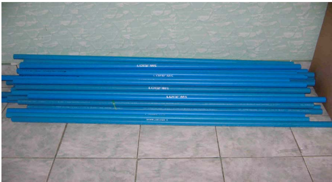
ภาพประกอบ 9

ไม้พลองที่ใช้ในการออกกำลังกายรำไม้พลองบ้านบุญมี