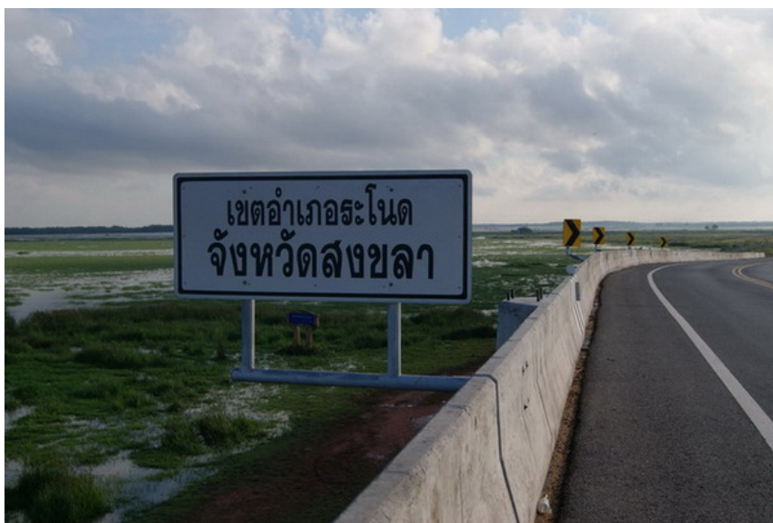
ชมรูปภาพจากอินเทอร์เน็ต

7 ตุลาคม 2558 11:26 น. (แก้ไขล่าสุด 7 ตุลาคม 2558 11:49 น.)