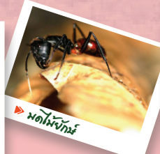
▶ มดไม้จันทร์