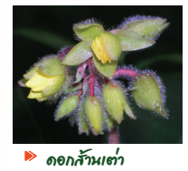
▶ ดอกส้านเต่า