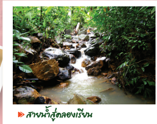
▶ สายน้ำสู่คลองเจ๊ก