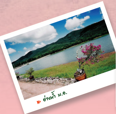
▶ อ่างน้ำ ม.อ.

บริเวณเขาคอหงส์นี้เป็นรอยต่อระหว่างเขตภูมิอากาศแบบชื้นกับกึ่งชื้น ลักษณะร่วมระหว่างป่าดิบแล้งและป่าดิบชื้น ประกอบกับพรรณไม้หลากหลายชนิดในพื้นที่เขาคอหงส์เป็นไม้ผลัดใบ