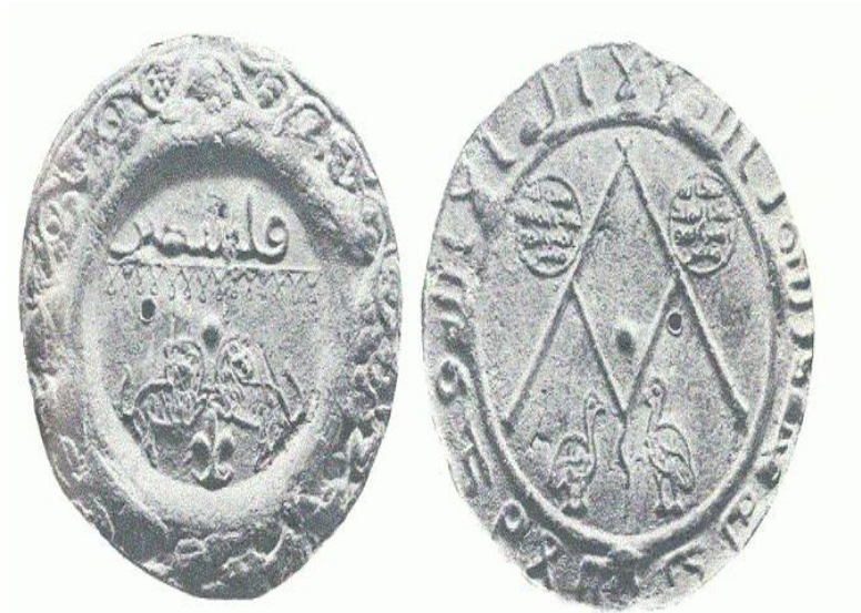
نموذجين لأختام تعود إلى الخليفة الأموي عبد الملك بن مروان - اسطنبول المتحف التاريخي