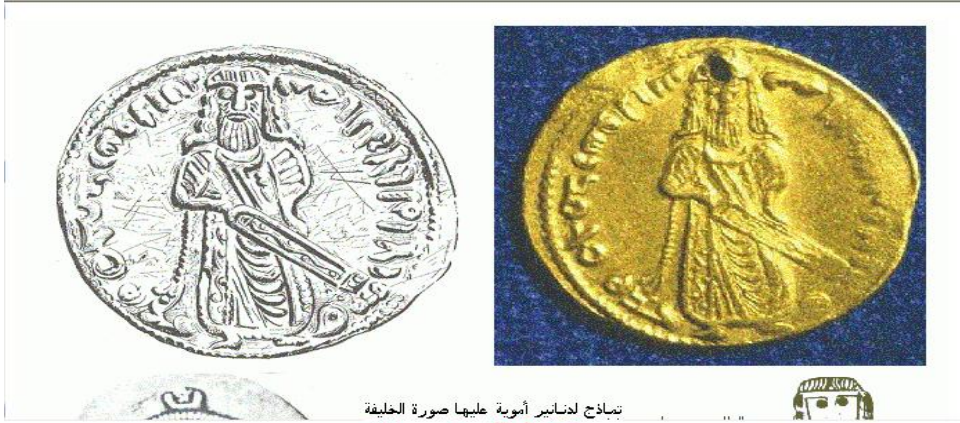
تبادج لدنانير أموية عليها صورة الخليفة عبد الملك بن مروان

รูปแบบต่างๆของเหรียญษาปณ์ดีนาร์และดรัมสมัยเคาะลีฟะฮ์อับดุลมาลิก บิน มัรวาน